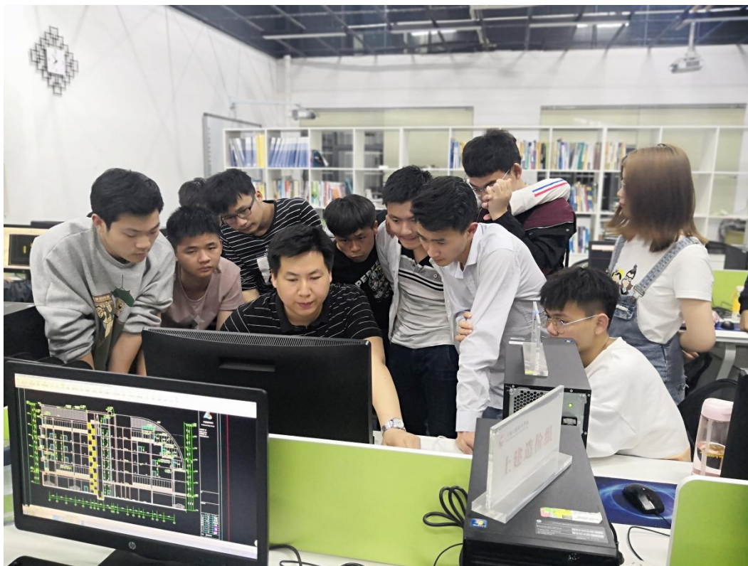
图 6：企业专家指导学生完成项目

通过四年的建设，“工、商融通”BIM金牌班和“工、商融通”工程造价金牌班，已经成为企业人才超市；成为由学生转变为职业人的平台；成为校企合作的纽带，得到了行业及兄弟院校的认可。武汉铁道工程学院、江西工业工程职业学院等多个兄弟院校来我院交流工作室及金牌班的经验。专职教师受邀参加行业会议，并多次作主题发言。为提高我院专业知名度起到了很好的促进作用。