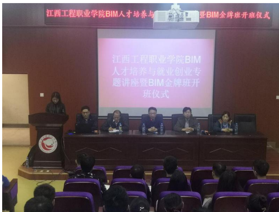
图 3：BIM 人才培养及金牌班开班仪式

类学生可辅修另一商科类专业，商科类学生可辅修另一工科类专业。学院目前开设的辅修专业有 14 个专业，从 2015 级起，所有学生必须辅修。（3）“专业大类+课程”。指学院分别从工科类和商科类学生中择优选拔 30 名学生组成“工、商融通”金牌班，工科类金牌班开设企业管理、电子商务、市场营销、会计、金融、保险等课程，商科类金牌班开设信息技术、电子技术、汽车维修技术、建筑工程技术、机电一体化技术等课程。金牌班采取“导师制”和“学徒制”等教学形式，集学院和社会最优资源，打造“工、商融通”型金牌人才。（4）“工科、商科专业互开职业通用能力与通识类选修课程”。学院要求学生在校期间必须选修三门“工、商融通”课程，三门课程中，工科专业学生必须要选修有一门商科类课程，商科专业学生必须要选修有一门技术类课程。