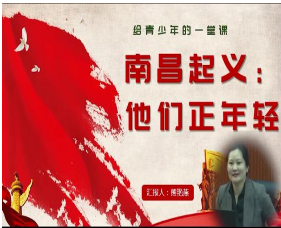
图 9：【安石论坛】第一期