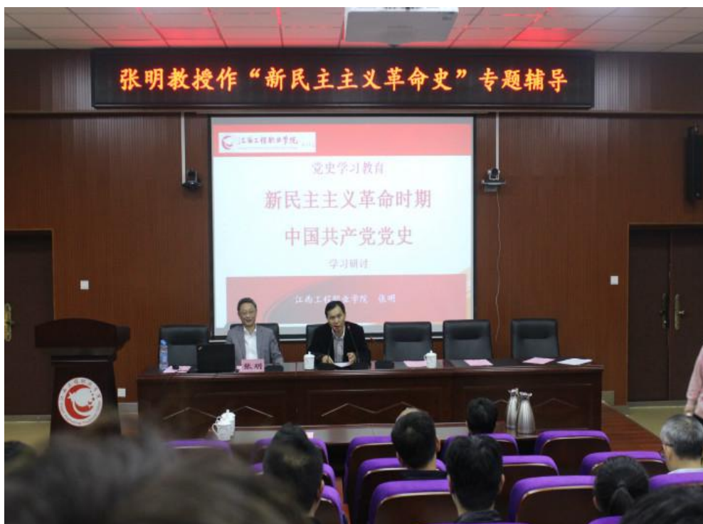
图 10：【安石论坛】第三期

为深入学习贯彻习近平总书记在学校思想政治理论课教师座谈会上的重要讲话精神，全面推动习近平新时代中国特色社会主义思想在江西的生动实践成果进教材、进课堂、进头脑，通过