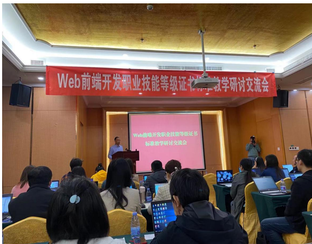
图5：组织教师参加1+X证书制度试点工作培训会议

养全过程，并把技能养成作为培养学生的重心和关键，积极探索“1+X”证书制度试点工作，全面提升学生的创新能力和综合素养。在教务处统筹下，计算机类专业有序推进“1+X”Web前端开发职业技能等级证书试点工作。教研室组织参加1+X证书制度试点工作培训会议，深入领会Web前端开发证书实施方案，积极探索课证融通，深化三教改革，扎实推进“1+X”Web前端开发证书制度试点工作。