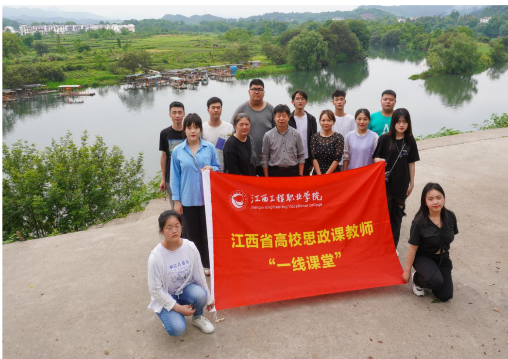
图 11：一线课堂师生在婺源扶贫点

“一线故事听变化、一线走读访样板、一线收获话真知、一线成果展风采”，推动学院思政课教师深刻领会、全面把握习近平新时代中国特色社会主义思想，增强思政课教学的思想性、理论性和亲和力、针对性。帮助思政教师更好地引导学生把爱国情、强国志、报国行自觉融入坚持和发展中国特色社会主义、建设社会主义现代化强国、实现中华民族伟大复兴的奋斗之中。根据教育厅关于一线课堂文件精神，学院组成包含师生的两支队伍赴学院扶贫点——婺源王村进行实地走访，通过采访驻村书记、扶贫队员、贫困户以及新时代文明实践中心，对我国扶贫政策在江西的生动实践进行汇总整理。