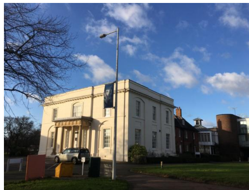
图 18：学院老师在英国开放大学进行交流与学习