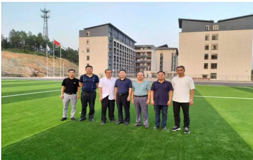
图 23：深入结对帮扶单位井冈山市旅游职业中等专业学校调研

行座谈交流。制定了《井冈山旅游中等专业学校思政教育基地建设方案》，通过开发特色思政课程、建设一支思政队伍、社会实践研学等活动、红色 VR 实训数字化课程资源平台系统建设等开展思政教育基地建设，资金预算 10 万元。学院将继续支持井冈山市旅游职业中等专业学校的发展工作，尽全力提升对口帮扶质量，落实“结对帮扶”要求，助力井冈山市旅游职业中等专业学校达到国家中等专业学校建设标准。