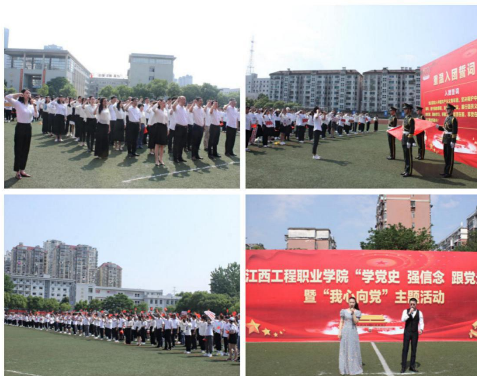
图 16：开展“学党史 强信念 跟党走”暨“我心向党”主题活动

为庆祝中国共产党成立100周年，深入贯彻习近平总书记在党史教育动员大会上的重要讲话精神，学院开展“学党史 强信念 跟党走”暨“我心向党”主题活动。全体师生同唱《没有共产党就没有新中国》、《唱支山歌给党听》落下帷幕。同时，大会还表彰了江西工程职业学院2020年度“优秀共青团员”、“优秀共青团干部”、“五四红旗团支部”、“五四红旗团总支”，学生代表朗诵《红色故事》、教师重温入党誓词、学生重温入团誓词。全体师生以昂扬的精神风貌迎接建党100周年，用青春之理想、青春之活力、青春之奋斗，在实现中国梦的实践中放飞青春梦想，书写属于自己的壮丽篇章！