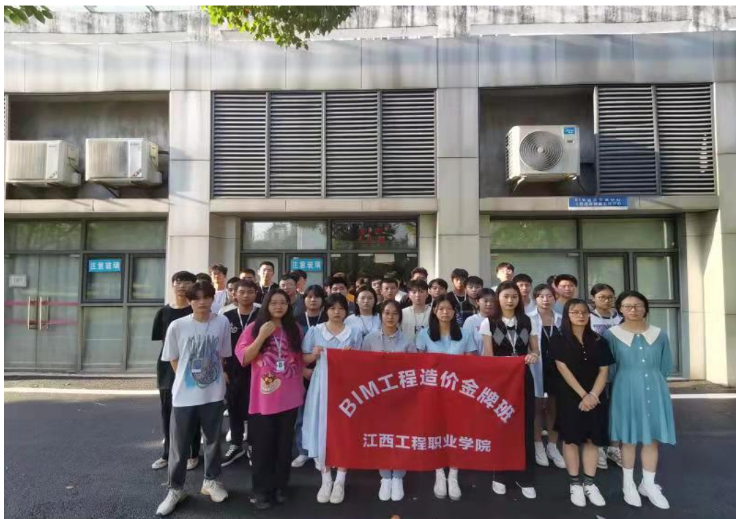
图 4：2021 届 BIM 工程造价金牌班合影