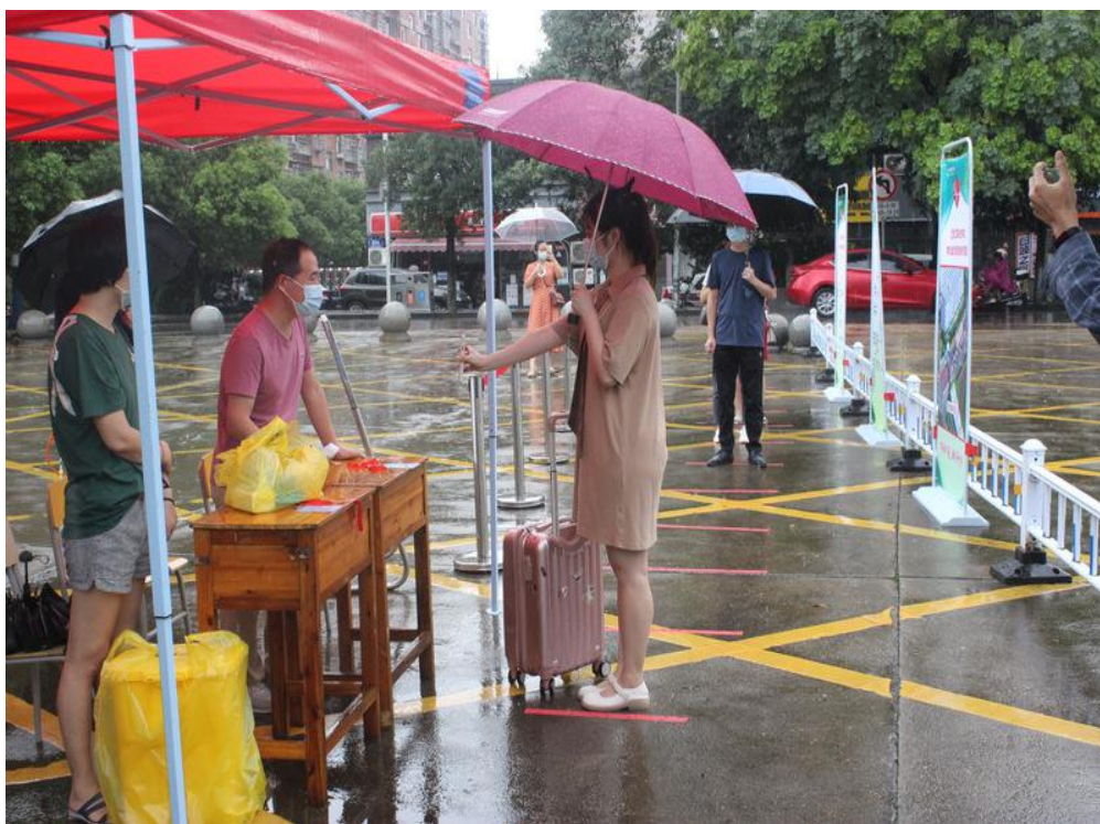
图 17：学院进行开学前防疫演练

新冠肺炎疫情以来，学院成立了专项工作领导小组，制定了相关的防治管理方案，严密排查师生出行情况和身体健康状况，有针对性地做好返校前后的健康教育，确保师生安全返校。科学严格管理，认真落实疫情防控要求，夯实工作责任，细化防控措施，加强校园出入管控，做好校内消杀工作，切断病毒传播途径。做好物资储备筹划，储备3间住人集装箱，红外线热成像仪、口罩、体温表等防疫物质，满足全体师生防疫物资需求，热成像仪对师生体温进行动态监控。强化沟通、协调，建立疫情防控专项沟通群，加强横向沟通和纵向沟通，统筹指导抚河校区各分院、青云谱校区师生的排查等防控工作。