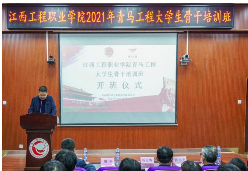
图 15：“青马工程”大学生骨干培训班开班

开展“青马工程”大学生骨干培训班，通过理论教育、实践锻炼、革命教育等方式，提升青年学生骨干的思想政治素质和理