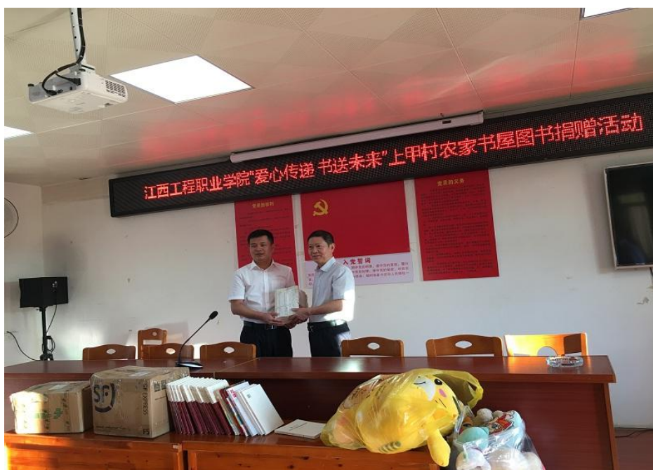
图 20：农家书屋图书捐赠活动

了“王村党建经费农家书屋”、“王村党建经费爱心超市”工作站，继续在王村外俞党员活动室内搭建新时代文明实践工作站（内设农家书屋、爱心超市等）。加大特色宣传和农产品的销售，提高消费扶贫的力度，统一大宗采购王村扶贫产品如“大米”等进入学校和学院食堂餐桌；在学院食堂设立扶贫农产品集中发放点，定期采购、销售王村农副产品，推动王村农副产品在学校、学院周边社区进行的宣传。已建成“王村党建经费农家书屋”、“王村党建经费爱心超市”工作站、“扶贫产品直销馆”、“户外拓展基地”。今年教职工购买农副产品达 2.3 万余元。