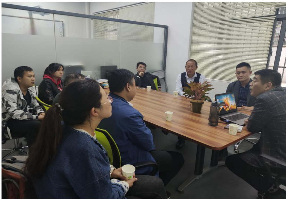
图 7：兄弟院校来我院交流经验