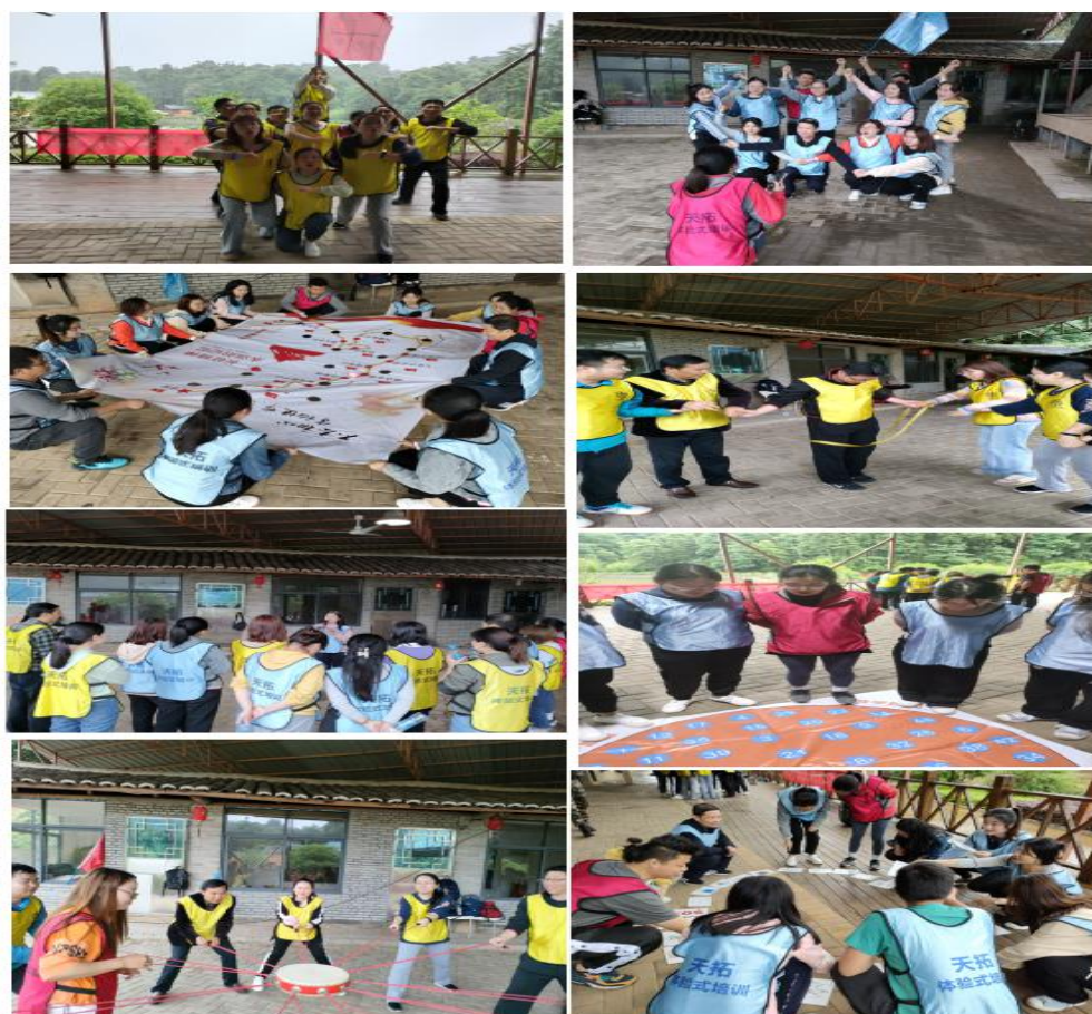
图 8：党史学习教育专题培训班暨辅导员、心理健康教师校外素质拓展训练现场