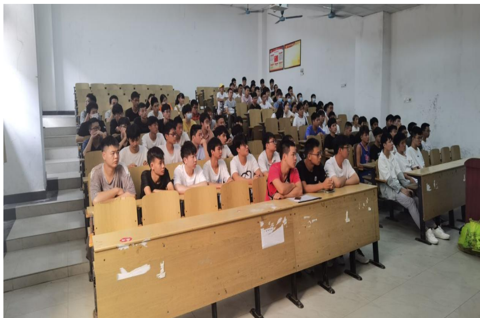
图 12：防范校园贷主题班会现场

了新生签订《校园贷风险告知书》，开展主题班会、主题演讲比赛等，将校园贷主题宣传教育和校园贷教育作为一项常态化工作来抓。