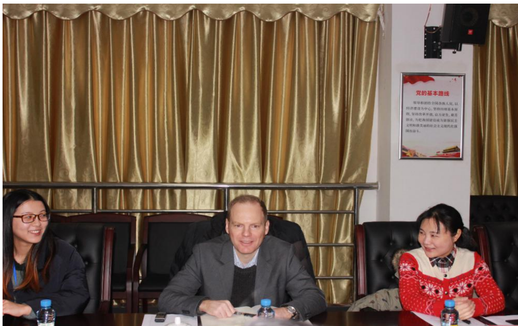
图 19：德国莫悉明博士来我院友好访问

流座谈会，向学院详细介绍德国双元制职业教育的先进经验。为学院今后的教学改革开拓了思路。