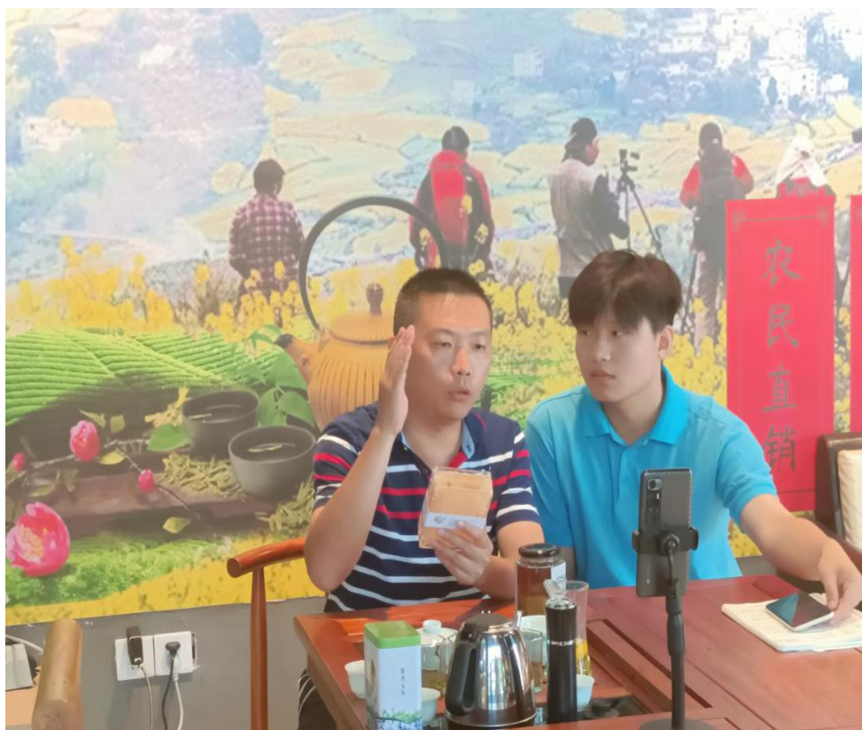
图 22：帮扶婺源王村开展“聚云助农，直播带货”活动